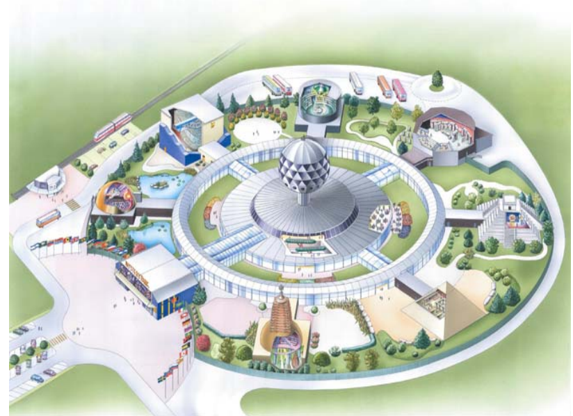
Die Wirtschafts- und Wissenschafts-Akademie der Dharma-Ethikpartei mit den Studienhäusern der Weisheiten der geistigen-spirituellen Kulturen

- Kerngebiet der Akademie : Das ist die eigentliche Akademie , die Ausbildungsstätte der korruptionsfreien, ethisch Gebildeten. Hier befinden sich Auditorien, Bibliotheken, Unterkünfte und ein Messegelände in denen die weiterführenden Prinzipien einer humanen Wirtschaft und die Qualitäten und Pflichten der korruptionsfreien, ethisch Gebildeten vermittelt werden (siehe unsere Ethik-Definition auf: www.ethikpartei.ch ).