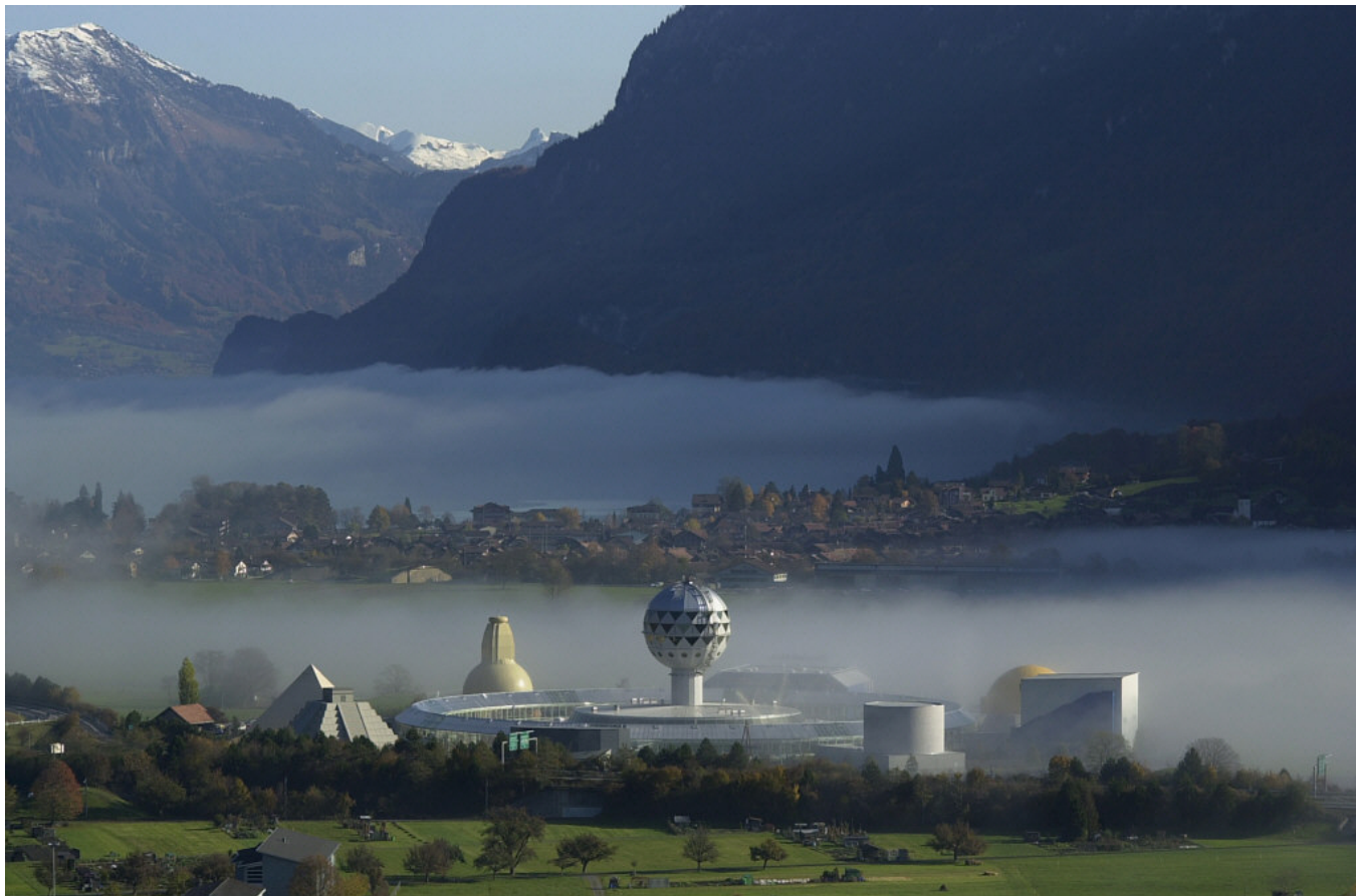
Möglicher Standort in Interlaken in der Schweiz ... (In der Infrastruktur des ehemaligen Mysteryparks)