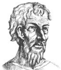
Niklaus von der Flüe